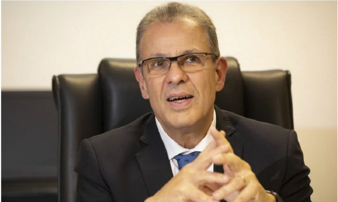
O ministro das Minas e Energia, Bento Albuquerque.

07/11/2019 - 04:30 / Atualizado em 07/11/2019 - 07:39