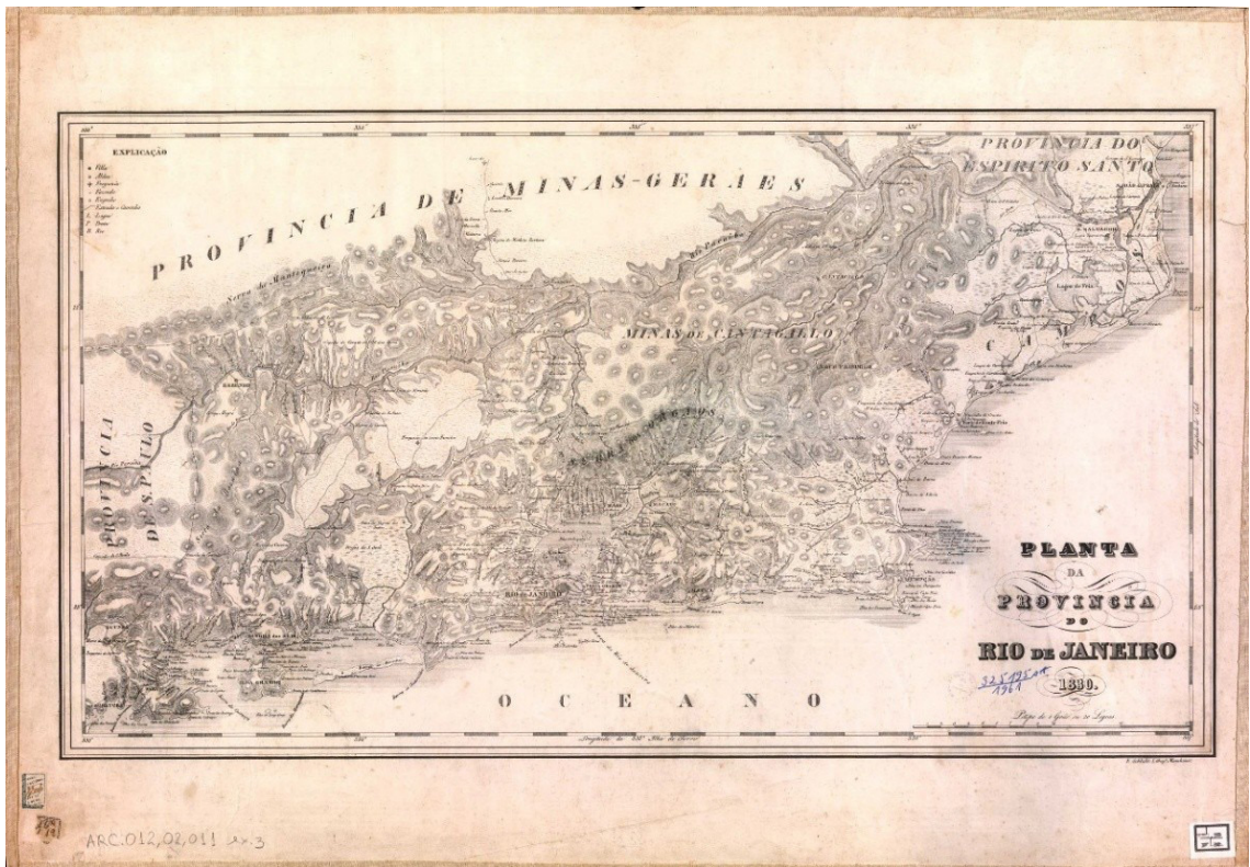
IMAGEM 1: Rudolph Shlicht, Planta da Província do Rio de Janeiro, 1830, coleção Teresa Cristina Maria (Biblioteca Digital Luso-Brasileira)