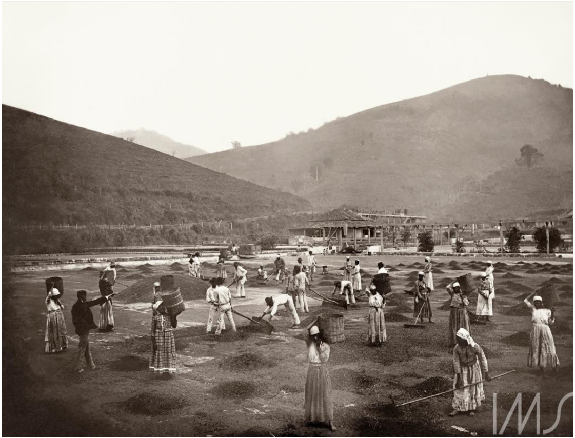
IMAGEM 2: Marc Ferrez, Escravos em terreiro de uma fazenda de café do Vale do Paraíba, circa 1882, coleção Brasileira Fotográfica (IMS)