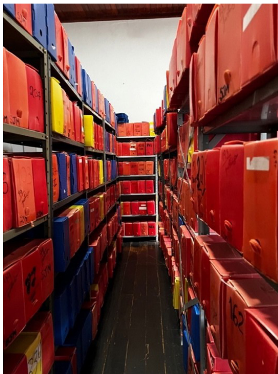
IMAGEM 4: Acervo de Rio Claro

O acervo estava acondicionado em sala de aproximadamente 30m 2 , sem climatização, mas com ventilação natural adequada. Foram identificadas cerca de 210 caixas com processos do século XIX e 135 livros