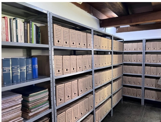
IMAGEM 5: