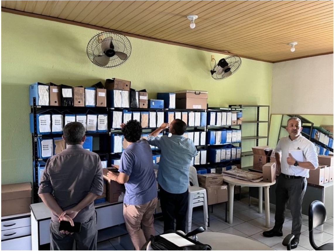
IMAGEM 8: Acervo do Arquivo de Resende