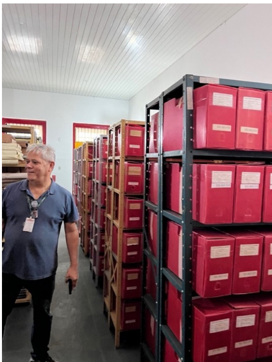
IMAGEM 6: Acervo de Vassouras

de registros. Fora elaborada uma planilha Excel com aproximadamente 3.000 processos indexados. A higienização básica já havia sido realizada anteriormente, mas não havia controle de temperatura nem digitalização. Os pesquisadores eram atendidos informalmente, e não havia registro sistemático dos atendimentos.