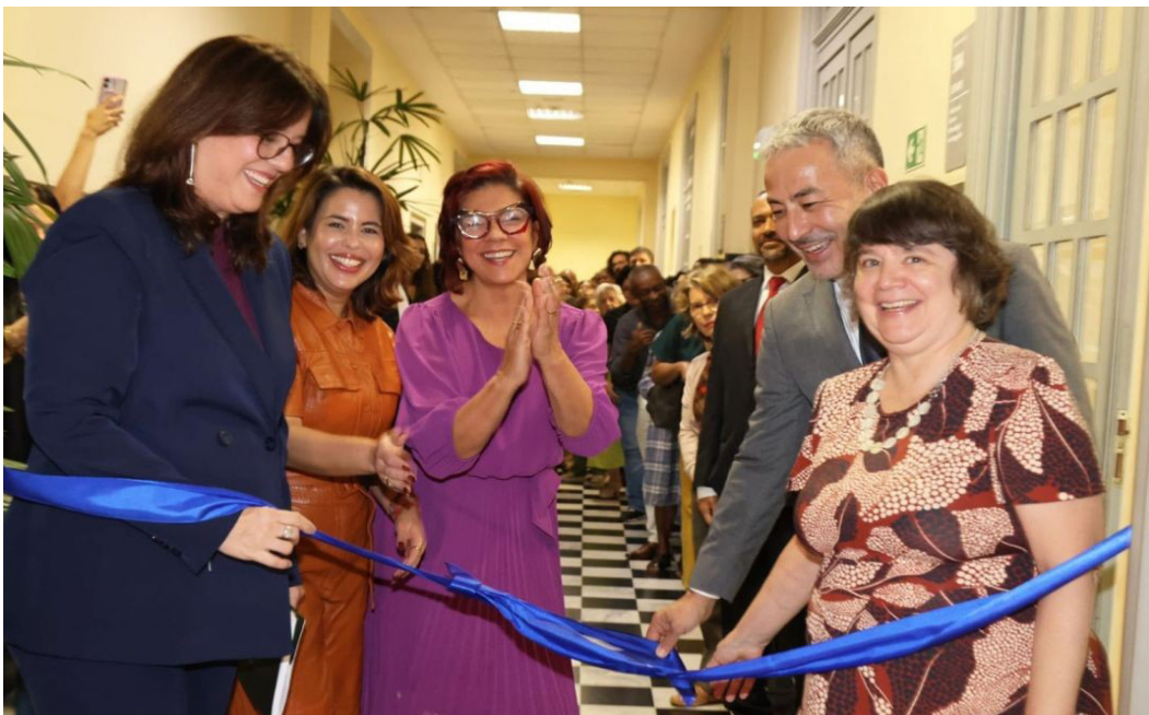
IMAGEM 11: Inauguração da exposição

A exposição “O Vale da Escravidão” reafirma o papel do Museu da Justiça como espaço de memória, pesquisa e educação, convidando o público a refletir sobre as raízes das desigualdades sociais que ainda persistem no Brasil.