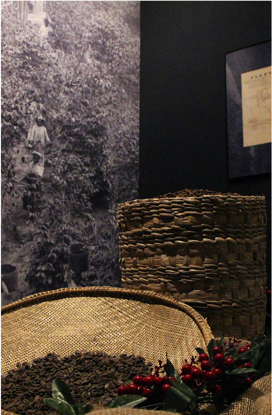
IMAGEM 12: Exposição "Vale da Escravidão"