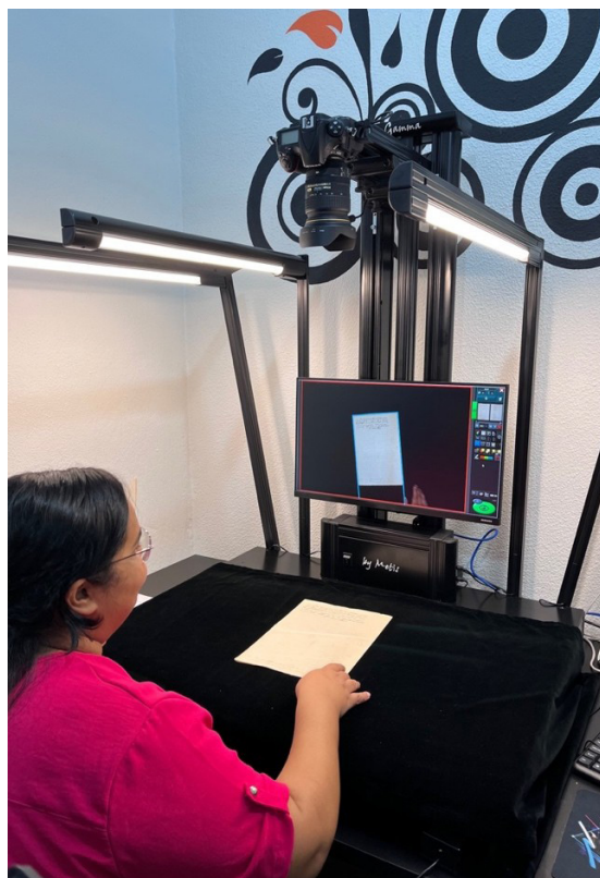
IMAGEM 9: Scanner planetário de alta definição adquirido com recursos de TAC e doado ao Arquivo de Pirai

E m setembro de 2024, o Ministério Público Federal firmou acordos de cooperação com os municípios de Pirai e Rio Claro, por meio dos quais destinou o montante de R$ 200 mil, oriundo de Termo de Ajustamento de Conduta (TAC), para a aquisição de equipamentos destinados à preservação documental. Entre os itens adquiridos estão um scanner planetário de alta definição e uma mesa de higienização de documentos, fundamentais para a conservação dos arquivos judiciais de valor histórico sob guarda desses municípios. O objetivo da doação é fortalecer as ações locais de preservação e garantir maior acesso público aos processos judiciais relacionados à escravidão no Vale do Paraíba Fluminense.