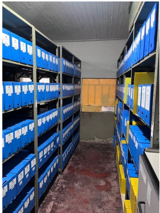
IMAGEM 7: Acervo do Município de Piraí

A visita técnica ao Município de Piraí foi realizada com inspeções na Secretaria Municipal de Cultura (Casa de Cultura) e no Arquivo Municipal, localizado na Rua Bulhões Carvalho, bairro Casa Amarela. Em razão de obras no prédio principal do Arquivo, os serviços de digitalização e atendimento a pesquisadores vinham sendo provisoriamente realizados na Casa de Cultura, em ambiente limpo, iluminado e organizado.