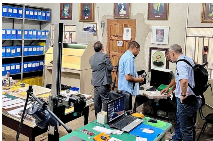
IMAGEM 3: Visita técnica ao Arquivo Municipal de Piraí

Apresentamos a seguir uma síntese das visitas: