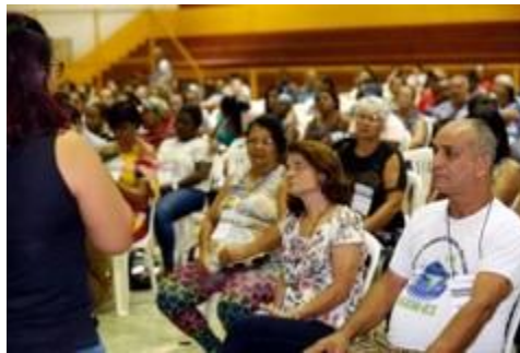
Acima, momento da escolha da ADAI como Assessoria Técnica de Baixo Guandu. À esq., inscrição na chegada dos atingidos e atingidas ao evento de escolha; e apresentação da ADAI. 27 nov 2018.