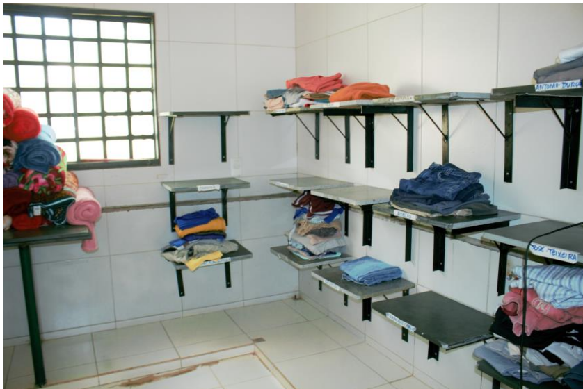
Foto 4 – Separação das roupas limpas para montagem dos kit's por residente.

19. A respeito da acessibilidade espacial para as/os idosas/os no LFA, para que possamos entender melhor sobre a adequação dos espaços, primeiramente cabe destacar uma breve reflexão sobre o processo de envelhecimento que “é caracterizado como um processo dinâmico, progressivo e irreversível, ligados intimamente a fatores biológicos, psíquicos e sociais 5 .