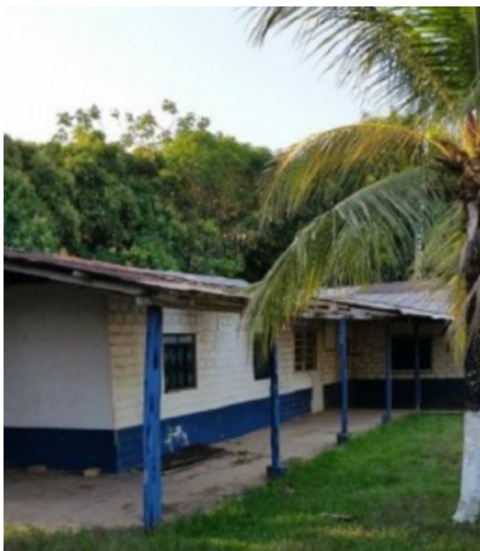
Imagem 5 - Casa Azul, Marabá (PA).

Trata-se de imóvel localizado em Marabá/PA, de propriedade da União Federal, atualmente destinado ao Departamento Nacional de Infraestrutura e Transportes – DNIT. Durante a ditadura militar, funcionou ali a base de comando de operações do Exército, com o fim de combater o movimento chamado Guerrilha do Araguaia. Guerrilheiros presos e moradores da região que davam apoio ao movimento armado eram levados para o local para serem torturados e mortos.