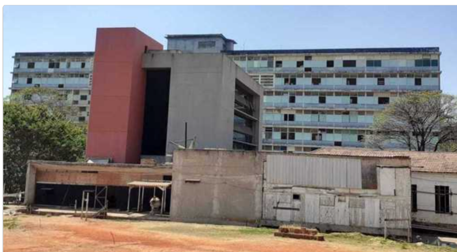
Imagem 7 - Memorial da Anistia.

Localizado em Belo Horizonte/MG, trata-se de uma obra iniciada sob responsabilidade da Comissão de Anistia, do então Ministério da Justiça, e da Universidade Federal de Minas Gerais (UFMG).