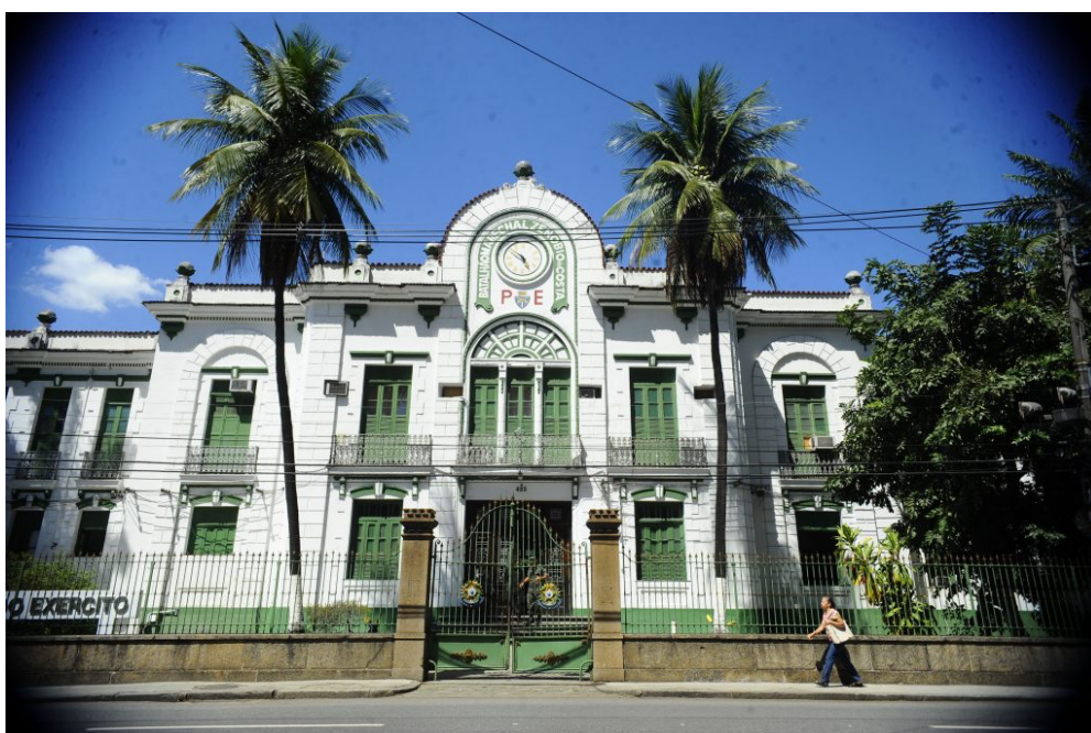
Imagem 3 - Antiga sede do DOI-CODI/RJ.