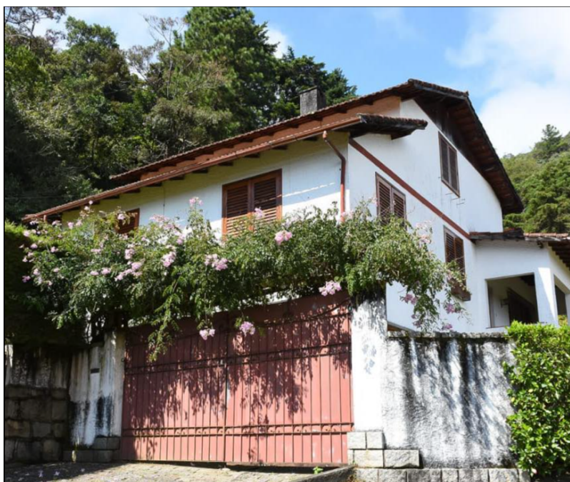
Imagem 1 - Casa da morte.

Situado na Rua Arthur Barbosa nº 50, em Petrópolis/RJ, o imóvel foi utilizado por agentes de repressão do Estado para a prática de tortura e outros crimes.