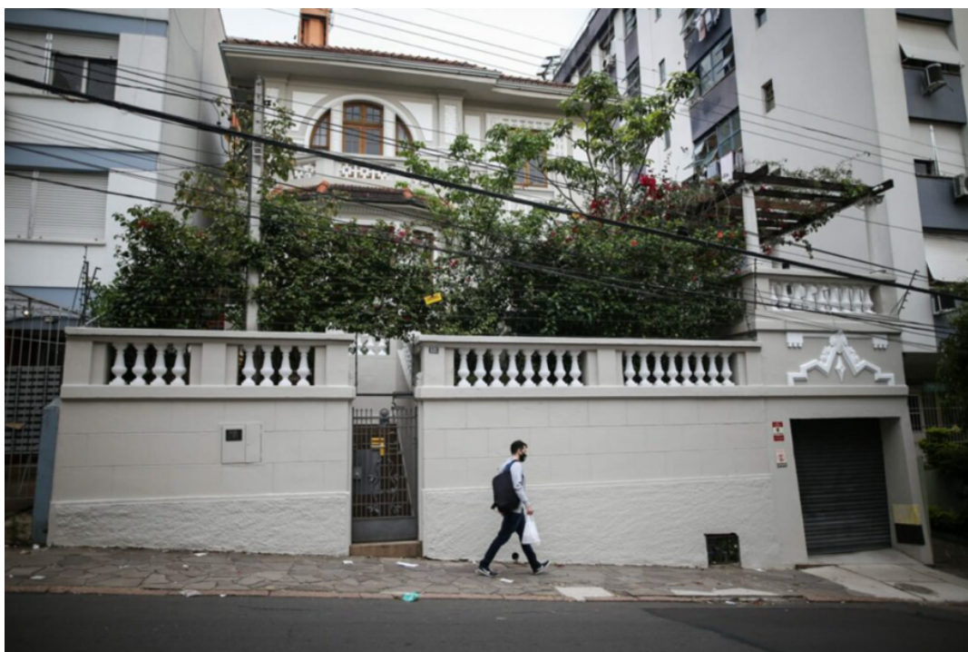
Imagem 4 - Dopinha.

Este é o apelido dado a um centro de tortura em Porto Alegre/RS, que teria sido o primeiro centro clandestino dessa natureza no Cone Sul. Trata-se de uma casa, localizada na rua Santo Antônio, no bairro Bom Fim, em Porto Alegre, de propriedade particular.