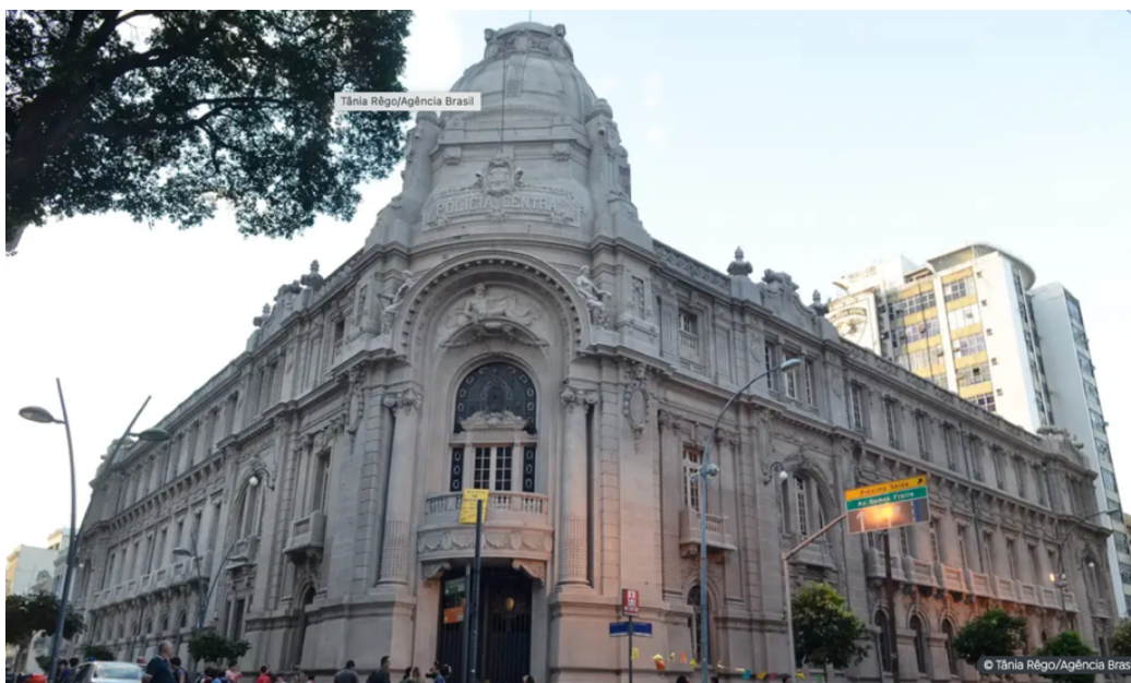
Imagem 2 - Antiga sede do DOP/RJ.

A antiga sede do Departamento de Operações de Ordem Política e Social do Rio de Janeiro (DOPS/RJ) fica no centro cidade do Rio de Janeiro/RJ, na Lapa, na esquina da rua da Relação com a rua dos Inválidos.