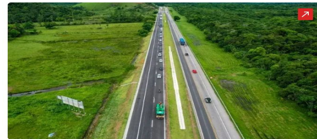
Concessões rodoviárias foram destaque do 1º semestre

Daniilo Moliterno , da CNN 03/08/25 às 03:52 | Atualizado 03/08/25 às 03:53