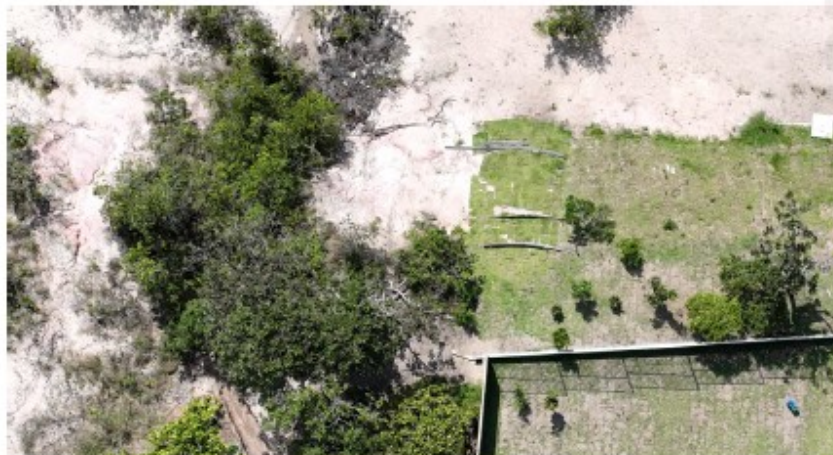
Devido à falta de aderência, resultante da natureza solta e granular da areia de praia, a grama colocada pelo proprietário do imóvel não está devidamente fixada.