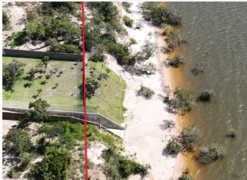
A linha vermelha identifica o muro construído para proteção do imóvel. Entre o muro e o rio, há praia, conhecida como Jacundá, e foi sobre ela que se estabeleceu a rampa e a fixação do gramado.