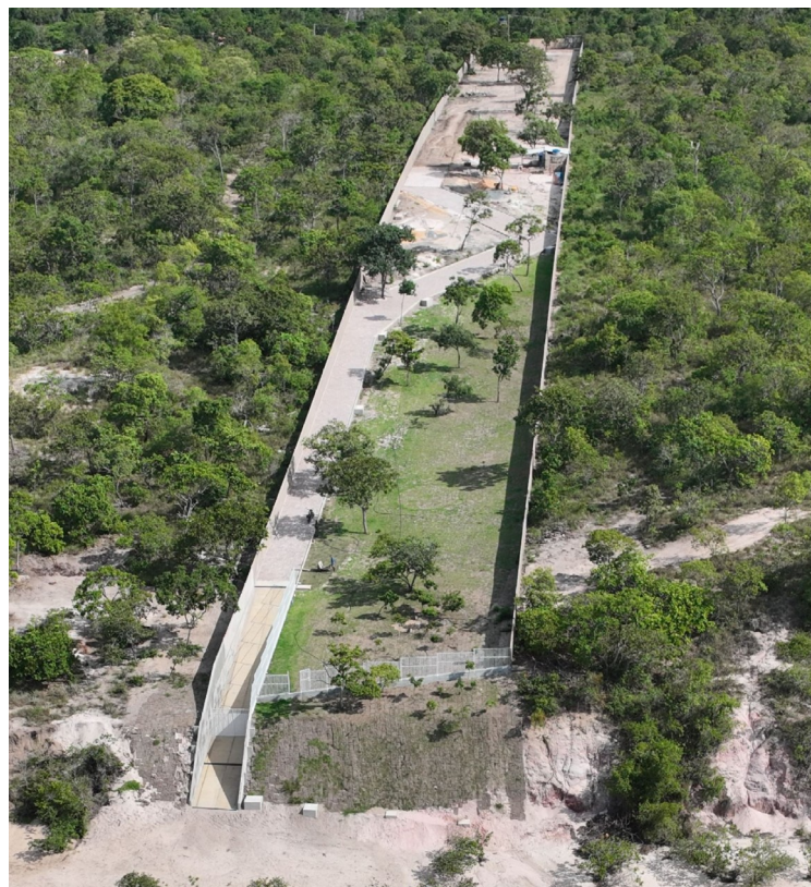
Imóvel construído na Área de Proteção Permanente (APP) de Alter do Chão Praia do Jacundá/Merakaiçara

CONSIDERANDO que o Relatório Circunstanciado de Diligência Externa, de 6.2.2024, constatou a existência de construção em Merakaiçara, atualmente denominado Jacundá I e II, tal como denunciado pelos indígenas, sob as coordenadas geográficas 02°30'58.8"S e 54°57'57.9"W (doc. 20), conforme imagem abaixo: