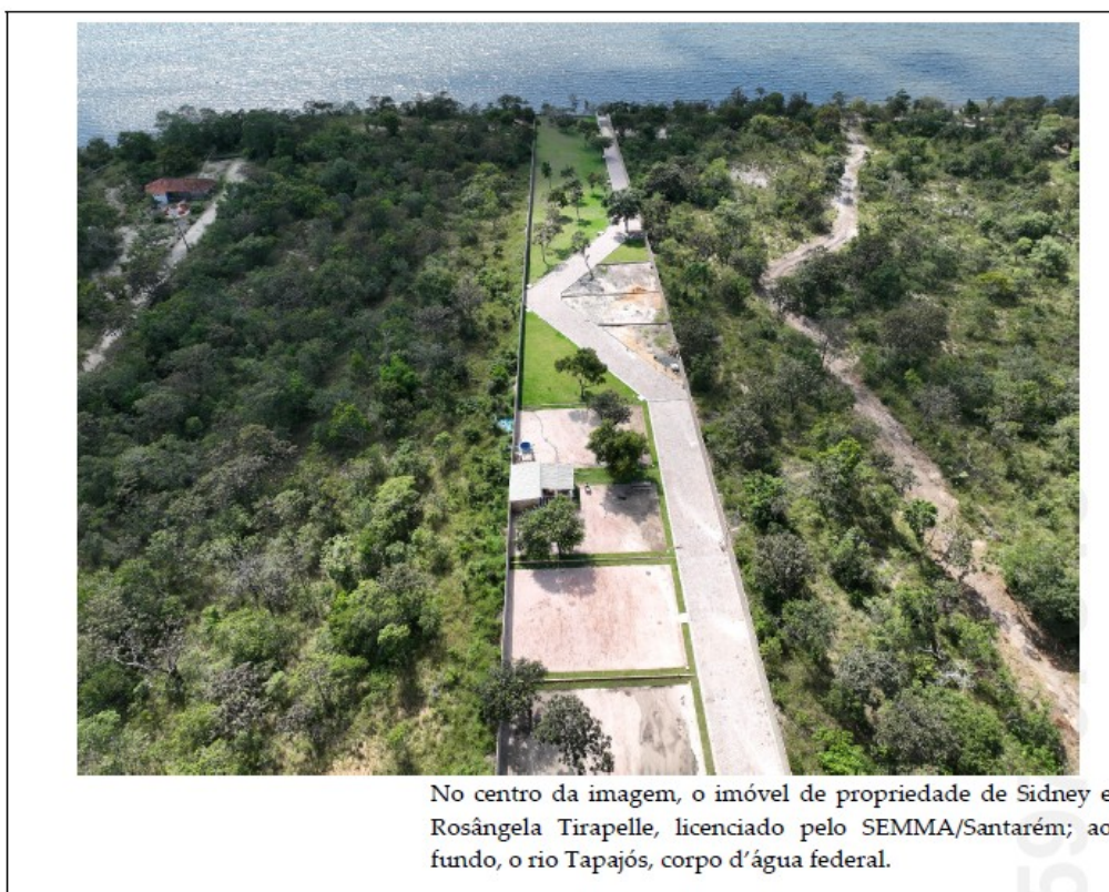
No centro da imagem, o imóvel de propriedade de Sidney e Rosângela Tirapelle, licenciado pelo SEMMA/Santarém; ao fundo, o rio Tapajós, corpo d'água federal.

6. Para a atividade de “edificação unifamiliar, em áreas protegidas ou sensíveis”, requerida por Sidney Tirapelle, o Parecer Técnico nº 2023/0001010 serviu de suporte para a Licença Prévia nº 2023/0000046, com validade até 27/11/2024, e para a Licença de Instalação nº 2023/0000062, válida até 27/11/2025.