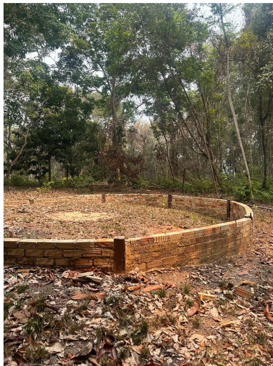
Uma das salas de aula para educação ambiental na Escola da Floresta.

CONSIDERANDO que a promoção da educação ambiental em todos os níveis de ensino e a conscientização pública para a preservação do meio ambiente são deveres constitucionais do Poder Público, nos termos do art. 225, § 1º, VI, e da Lei Federal nº 9.795/1999;