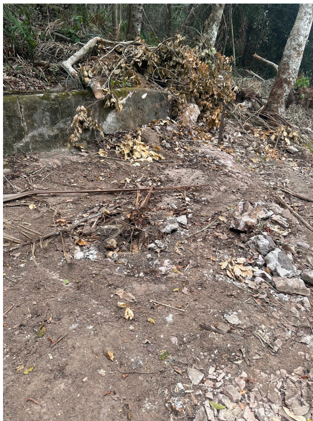
Foto de terra preto “de índio”, identificada por lideranças indígenas na inspeção realizada pelo MPF no dia 15 de novembro de 2025. Trata-se de solo naturalmente fértil, fruto do manejo da terra com produtos e subprodutos orgânicos por populações que viviam na região há milênios, contendo fragmentos de cerâmica e cemitérios de antigas ocupações.

CONSIDERANDO que na Escola do Campo Irmã Dorothy, logo ao lado do lote onde está sendo construído o condomínio de luxo QUINTA DE VILLA RESIDENCE – há apenas 2 minutos de carro –, foi encontrado um sítio arqueológico, denominado Makukawa , pelo projeto de extensão “Arqueologia na Escola: Histórias da Amazônia”, da Universidade Federal do Oeste do Pará (UFOPA):