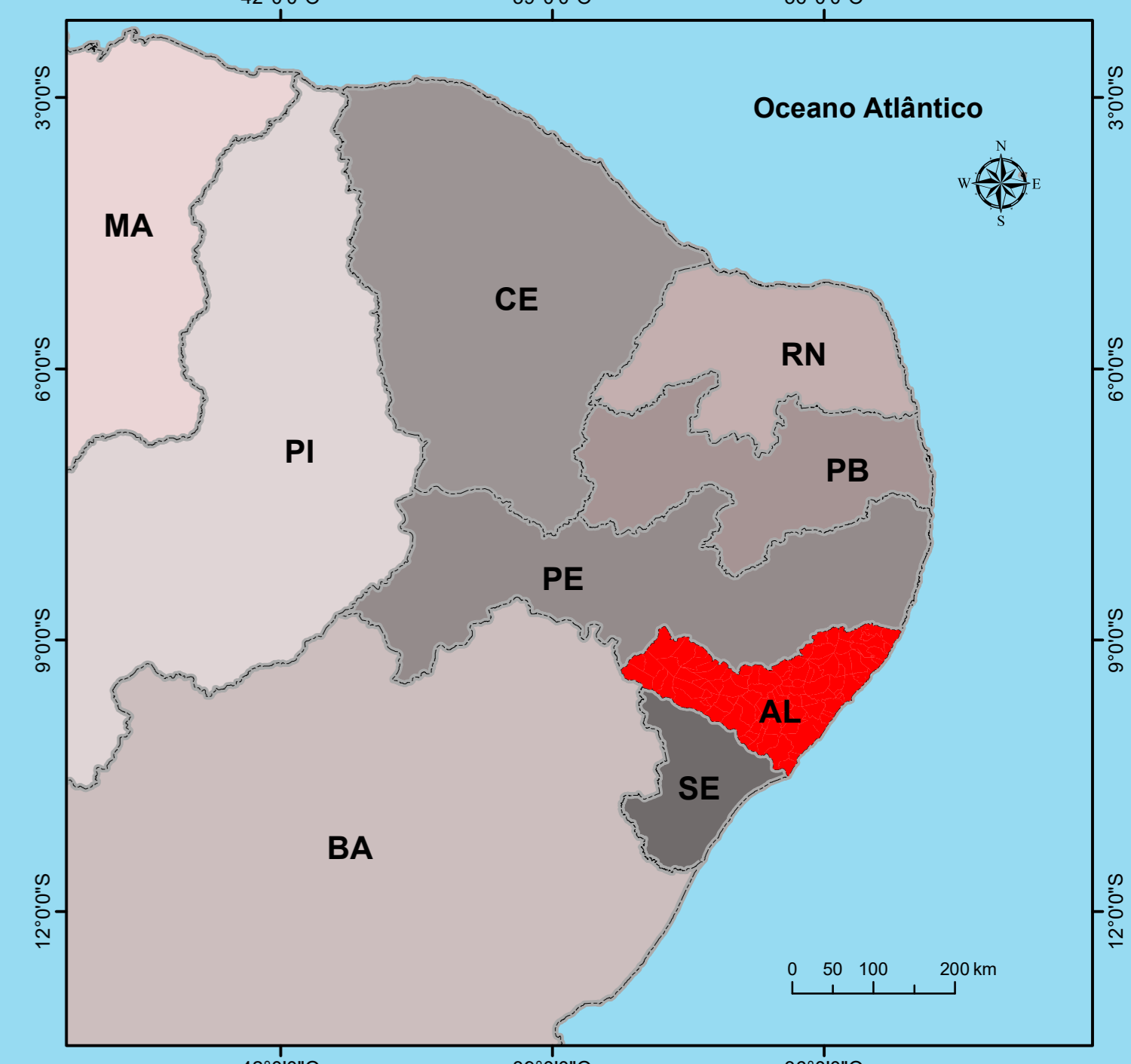
Mapa de localização do Estado de Alagoas - Brasil