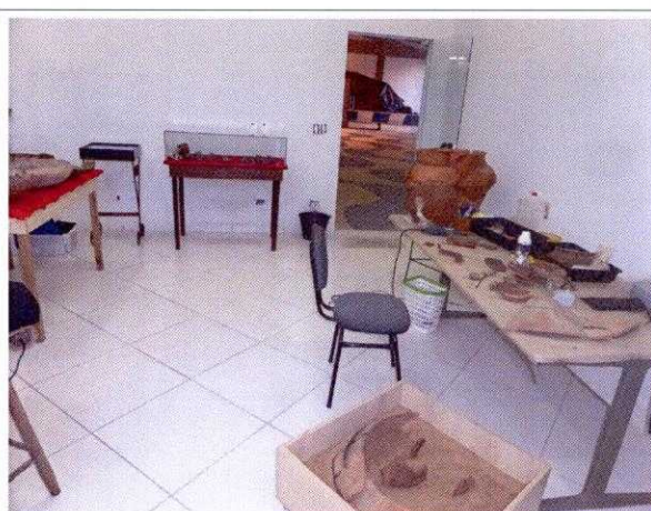
FIG. 14 – Sala de restauro das peças arqueológicas na UNESP - Presidente Prudente.

Desde a fundação do MAI, uma grande quantidade de publicações e pesquisas acadêmicas (Tabela 1) foram realizadas com os trabalhos de arqueologia preventiva que auxiliam na divulgação e entendimento histórico de ocupação humana na região.