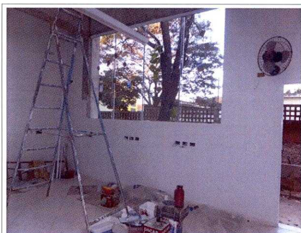
FIG.13 – Reforma do laboratório de arqueologia da UNESP – Presidente Prudente.