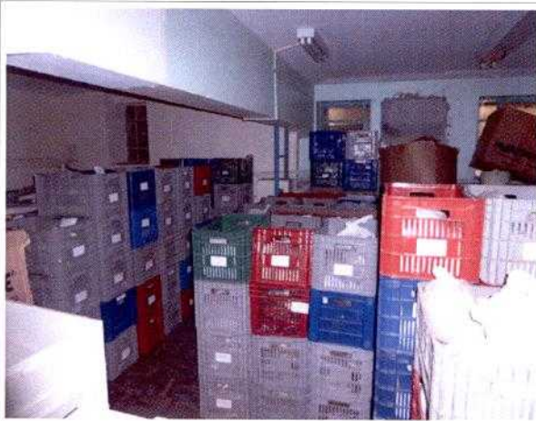
FIG. 3 - Caixas de engradado com material arqueológico coletado pelo arqueólogo Marco Aurélio De Masi.