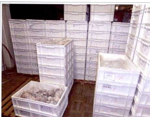
FIG. 7 - Material arqueológico triado, analisado e acondicionado em caixas do tipo marfinitite.