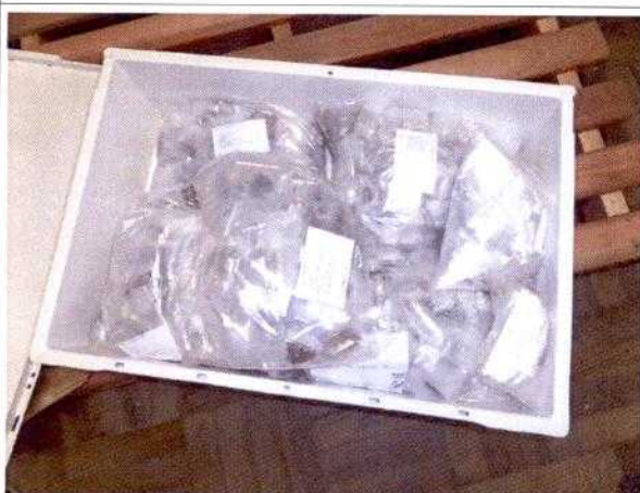
FIG. 8 – Caixa marfinitite com os vestígios arqueológicos devidamente triados, embalados e etiquetados.