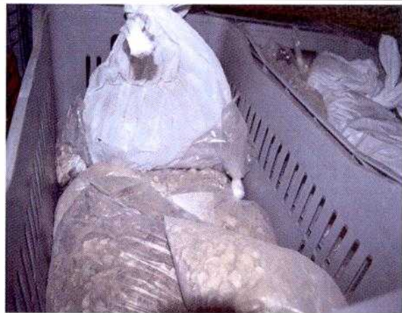
FIG. 4 - Detalhe dos sacos plásticos com material sem nenhum trabalho de limpeza e/ou triagem. Muitos estão sem nenhuma etiqueta de identificação do material.

A vistoria foi realizada na área onde estavam acondicionados os materiais arqueológicos de maneira provisória. Segundo a arqueóloga Deisi Scunderlick Farias, existe uma previsão de início das obras para reforma da Reserva Técnica para Junho de 2015, com um espaço de 300m 2 (FIG.5)