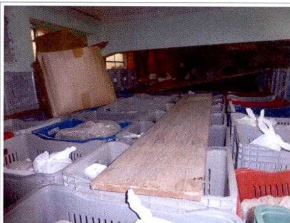
FIG. 2 - Caixas de engradado com material arqueológico coletado pelo arqueólogo Marco Aurélio De Masi.