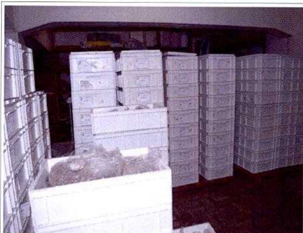
FIG. 6 – Material arqueológico triado, analisado e acondicionado em caixas do tipo marfinitite.

Observou-se a grande precariedade do espaço físico que se apresenta insuficiente, sem condições de armazenamento adequado do acervo arqueológico, sem armários, sinalização e/ou climatização. Segundo o arqueólogo Geovan Martins Guimarães, os outros materiais arqueológicos (tirando o dos engradados) já estão devidamente triados, analisados, registrados e acondicionados em caixas do tipo marfinitite (FIG.6,7,8 e 9).