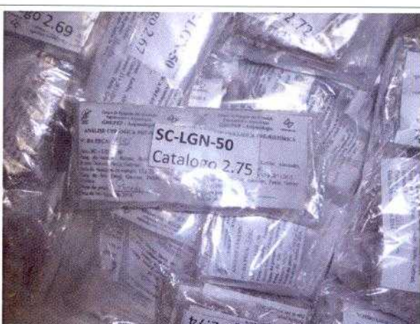
FIG. 9 – Detalhe das informações de cada uma das embalagens com vestígios arqueológicos.

Apesar de muitos materiais estarem embalados adequadamente, o espaço não é propício, por isso, observou-se a urgência em iniciar a reforma, para salvaguarda do patrimônio arqueológico.