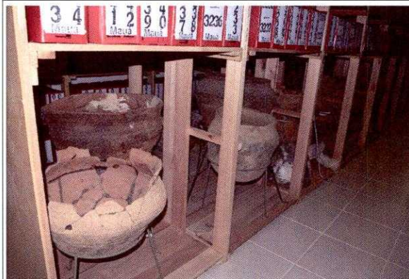
FIG. 15 - RT do CEPA. Vista geral das urnas e vasilhas cerâmicas acondicionadas na parte inferior da estante.