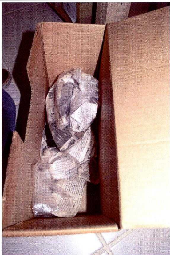
FIG. 17 - Acondicionamento do material arqueológico em papel de jornal e caixa de papelão.