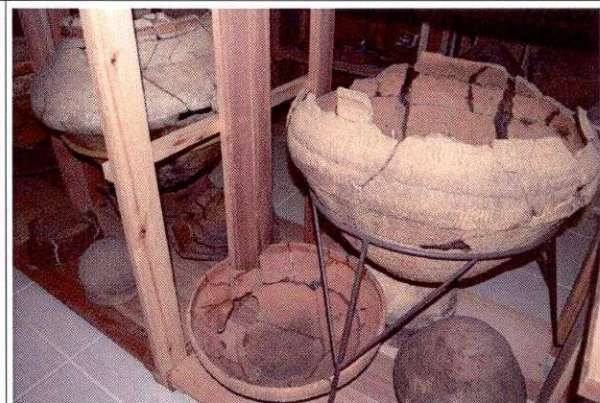
FIG. 16 - RT do CEPA. Detalhe das urnas e vasilhas cerâmicas.

Todo material foi embalado em papel de jornal, o que não é adequado para a sua conservação.