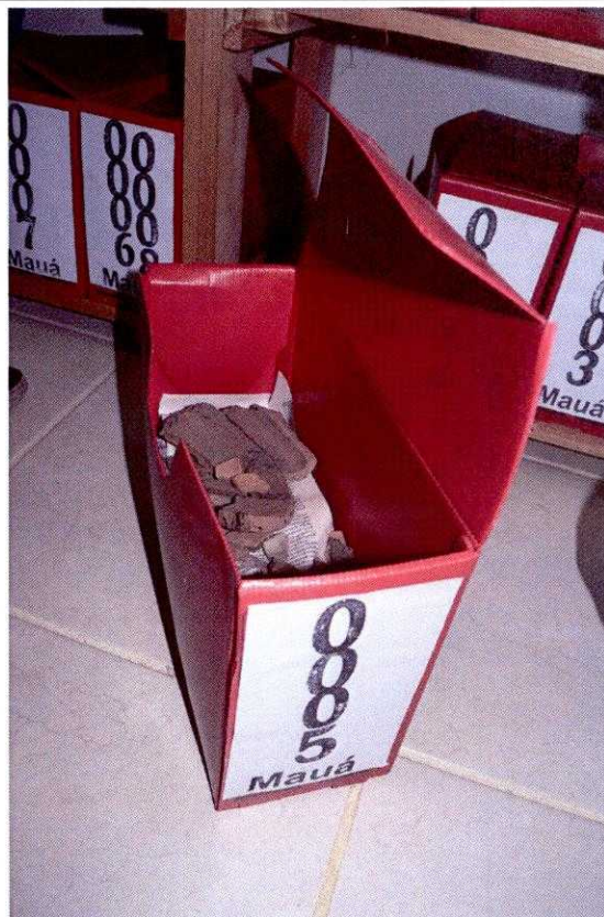
FIG. 18 - Acondicionamento do material arqueológico em papel de jornal e caixa de plástica.