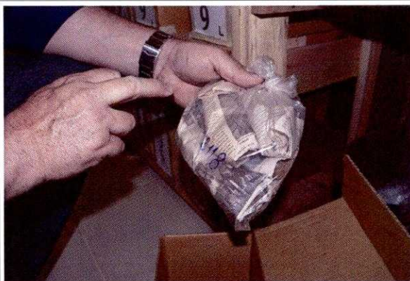
FIG. 20 - Detalhe do acondicionamento do material arqueológico em papel de jornal.