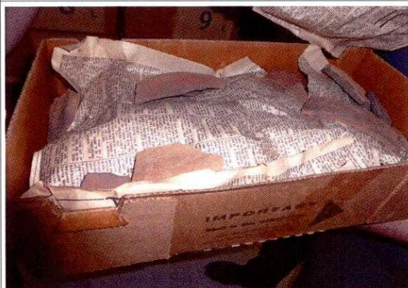
FIG. 19 - Acondicionamento do material arqueológico em papel de jornal e caixa de papelão.