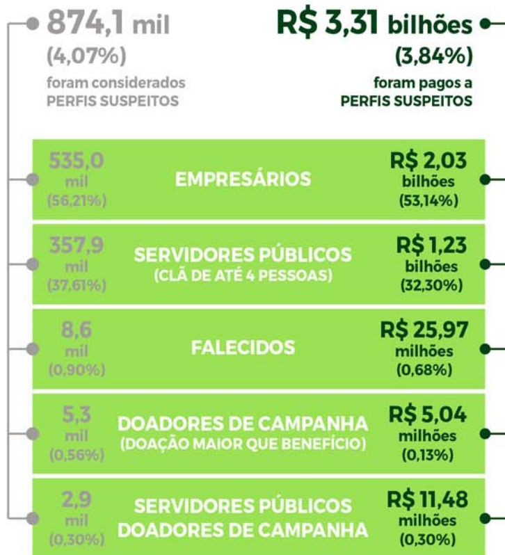
Percentual de Perfis Suspeitos (unidades da federação)