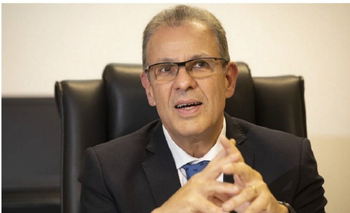
O ministro das Minas e Energia, Bento Albuquerque.

07/11/2019 - 04:30 / Atualizado em 07/11/2019 - 07:39