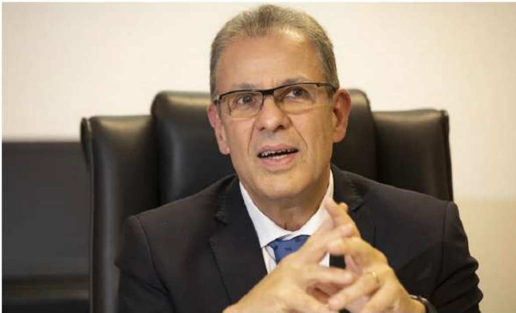
O ministro das Minas e Energia, Bento Albuquerque.

07/11/2019 - 04:30 / Atualizado em 07/11/2019 - 07:39